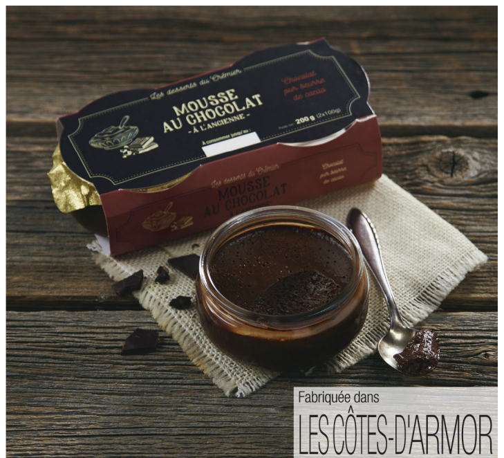
MOUSSE AU CHOCOLAT