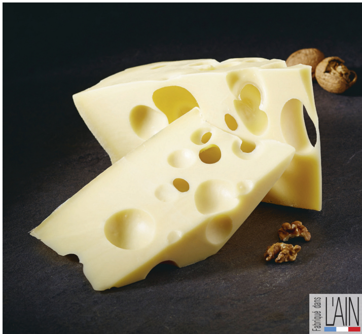
EMMENTAL GRAND AFFINAGE