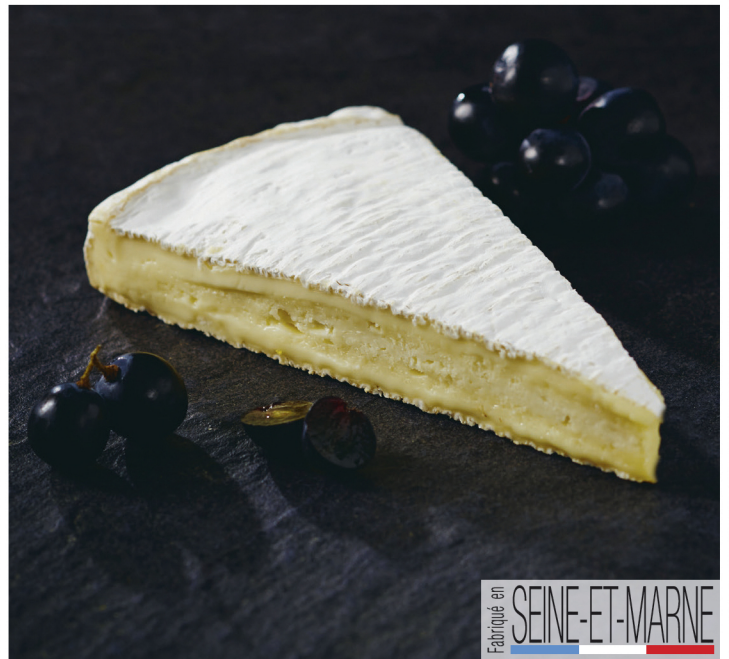
BRIE DE MEAUX AOP