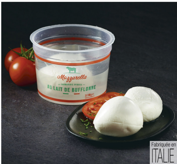
MOZZARELLA DI BUFFALA